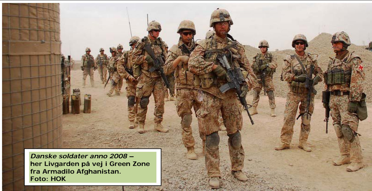
Danske soldater anno 2008 – her Livgarden på vej i Green Zone fra Armadilo Afghanistan.