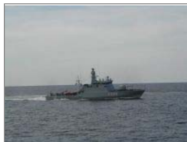
Tre skibe - Flyvefisken, Lommen og Hajen – har kursen sat mod Litauen. Det sidste, Sværdfisken, skal ophugges.

Tre skibe - Flyvefisken, Lommen og Hajen – er på vej til Litauen. Lommen vil imidlertid tidligst blive overdraget i 2008, når den er færdig som testplatform for kommando- og kontrolsystemerne til patruljeskibene. Skibene overdrages til litauerne i deres nuværende tilstand, - altså som de rene skibsskrog uden militære komponenter og systemer. Den litauiske flåde skal betale alle udgifter i forbindelse med overdragelsen, blandt andet renovering og uddannelse. Derfor kommer skibene til at koste litauerne op mod 25 millioner kroner alt efter hvad de vælger at købe og installere i dem. (FKO-Info)