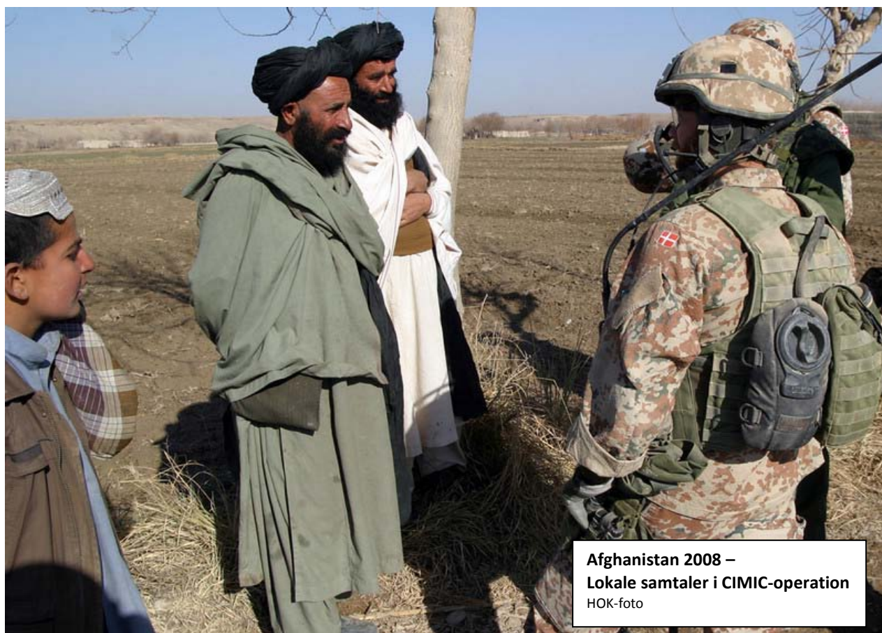
Afghanistan 2008 – Lokale samtaler i CIMIC-operation

Analysen viser i øvrigt også, at 92 % af befolkningen støtter politiet.